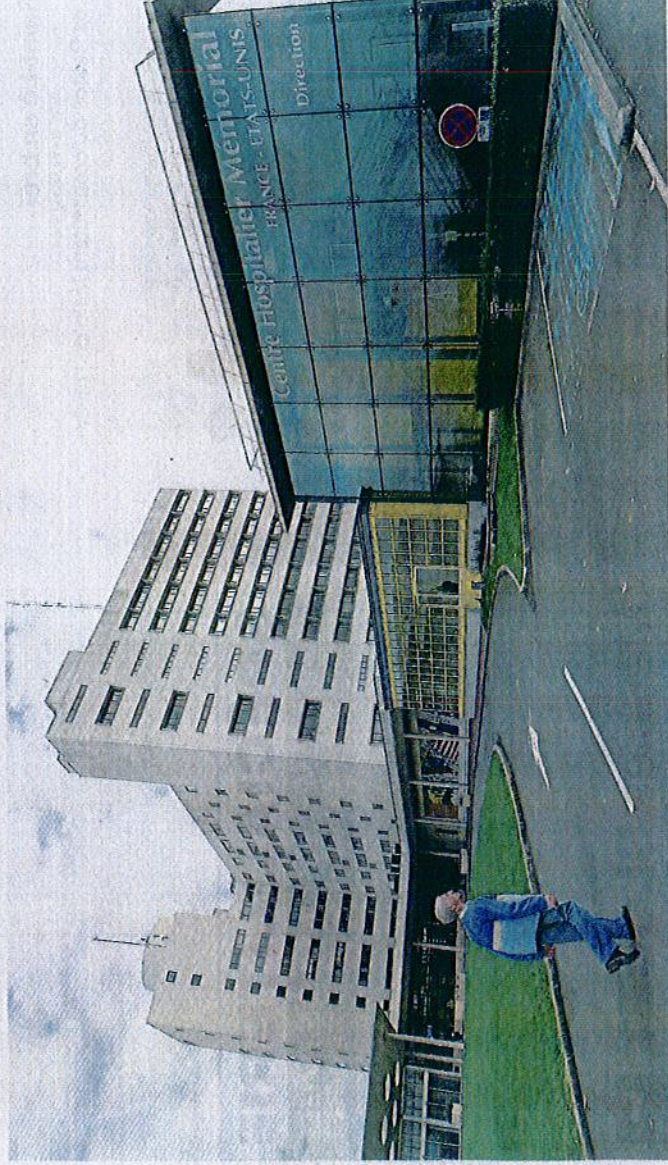
Les services de l'hôpital ont ouvert leurs portes à la rédaction d'Ouest-France pour évoquer le quotidien de l'établissement.