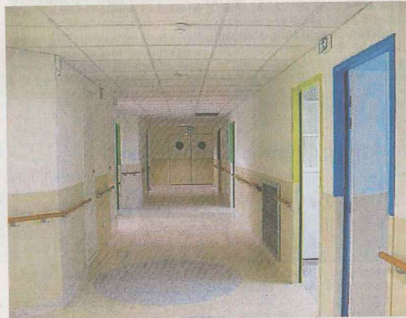
Le 1 er étage, après travaux.