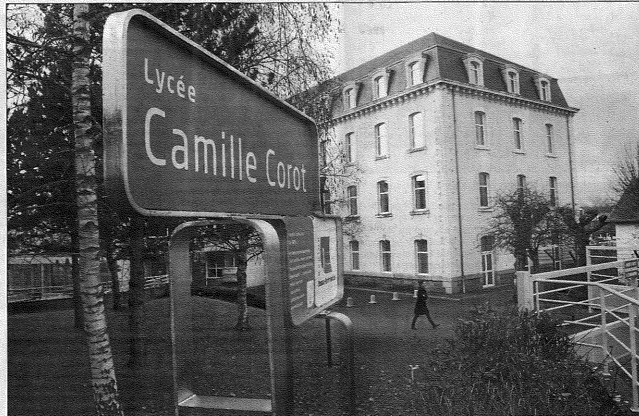
À la rentrée de septembre, les lycéens de Camille-Corot auront traversé la rue pour rejoindre leurs camarades de Pierre et Marie Curie. Leurs locaux actuels seront occupés dès l'automne 2015 par les élèves infirmières de l'IFSI.