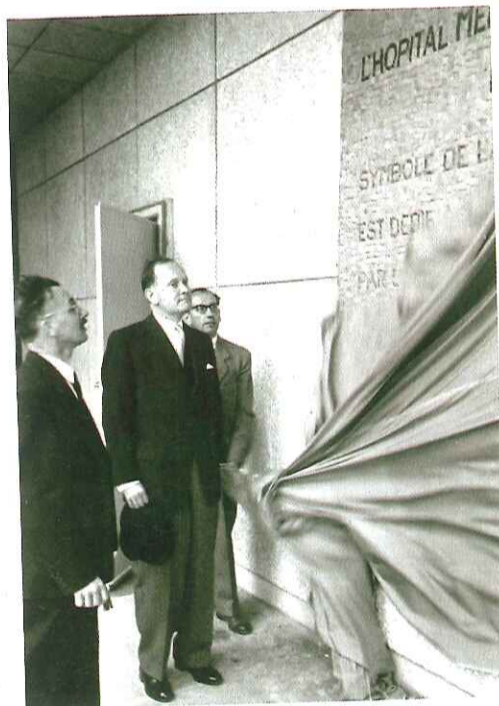
Le jour de l'inauguration, le 17 mai 1956.

■ Pratique. Jusqu'au lundi 16 mai, 60 ans de l'hôpital Mémorial, 715, rue Henri-Dunant. Contact : 02 33 06 33 33.