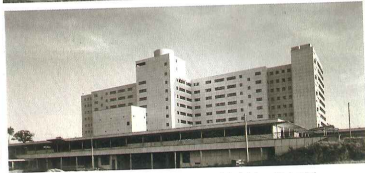
Spectacle de vidéomapping, feu d'artifice, concerts... L'hôpital Mémorial fête ses 60 ans cette semaine. Ci-dessus, sa construction en juillet 1950 (à gauche), en 1951 (en haut à droite) et une fois terminé.

P endant une semaine, les Saint-Lois qui passeront devant l'hôpital Mémorial auront peut-être l'impression de replonger 60 ans en arrière. Avec pléthore d'animations, l'établissement, classé au titre des monuments historiques, souffle ses 60 bougies.