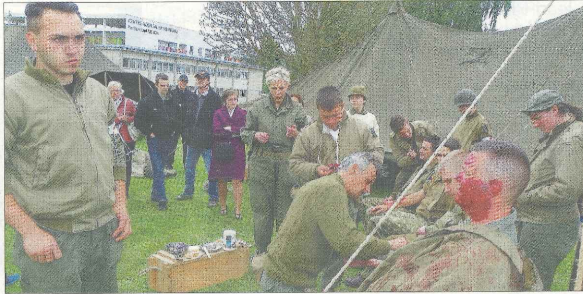
Des figurants ont été maquillés pour montrer les blessures d'époques. Le public a été impressionné.