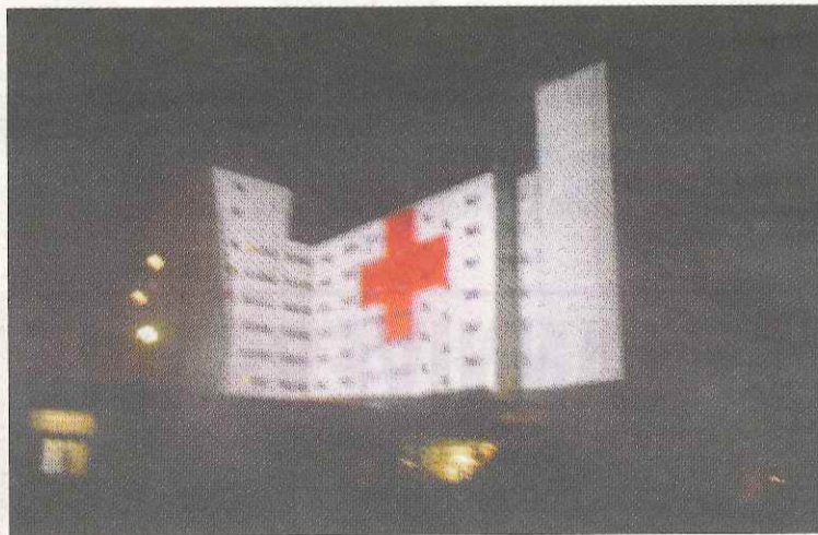
Dans la douceur de la nuit, la Croix Rouge projetée sur la façade de l'hôpital s'est inscrite comme un symbole de paix.

La nuit tombant, les murs se sont fait l'écran des photos et films projetés de cette époque révolue. Le diaporama proposé par Nicolas Chagon montrait des scènes à faire frissonner. Bombardiers rasant les murs et explosions