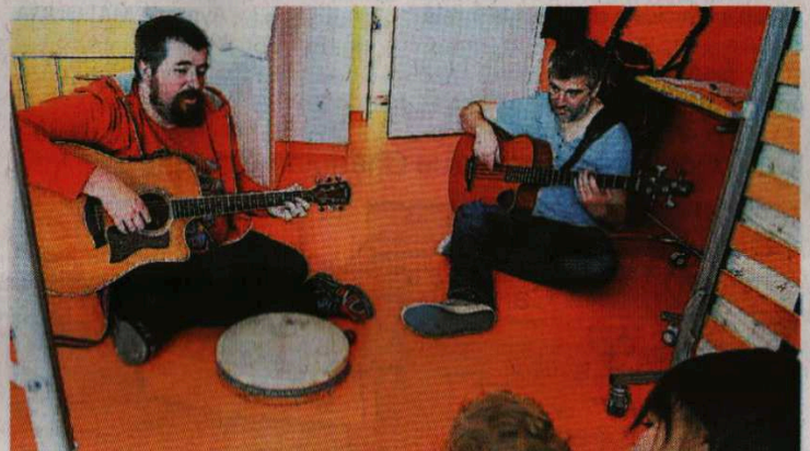
Le musicien est parfois accompagné d'autres artistes dans les différents services de l'hôpital de Saint-Lô.